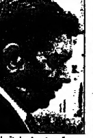
سليم بوعلام رئيس لجنة مراقبة الانتخابات الجزائرية